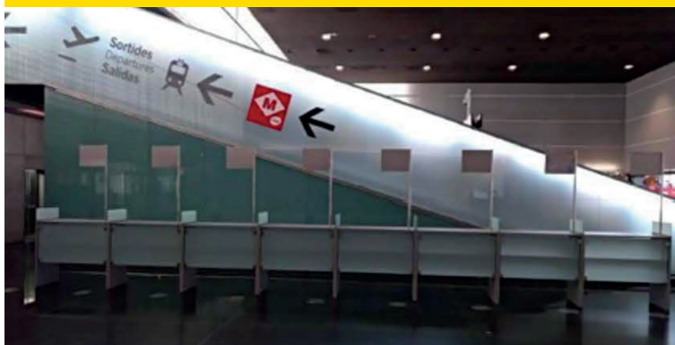
Фото места, где расположена компания « FROM2 » - напротив стоек регистрации 90-93. Терминал T2 В .

Обратите внимание, если Вы не используете данный трансфер, расходы по данной услуге, а также расходы по самостоятельному трансферу не компенсируются.